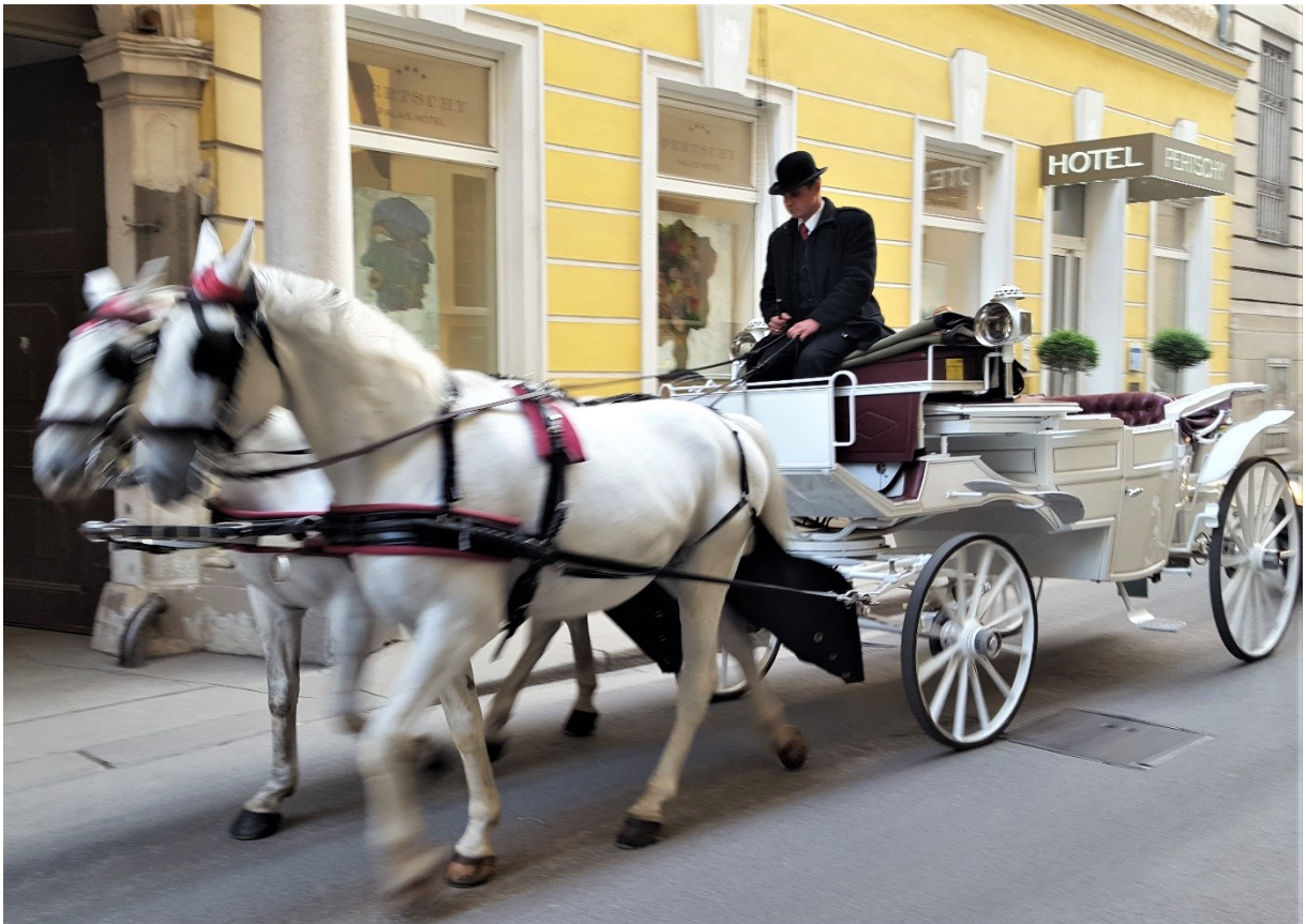
Das Hotel Pertschy mitten in Wien, gegründet von einem Wiener Kommerzialrat (Handelsrichter)

Jede Person gibt dem Hotel die eigene CC an für die Zahlung des Doppelzimmer-Anteils